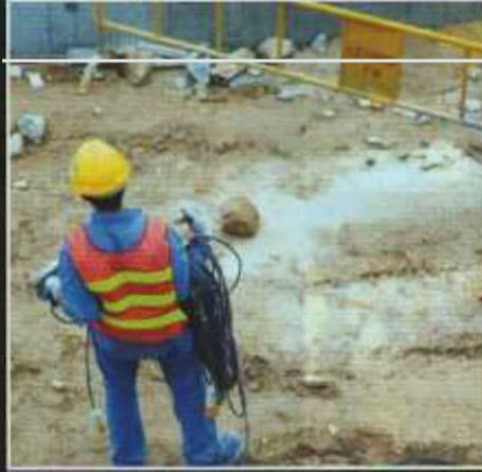
İşçilerin Kablo Ve Hortumları Taşıma Yükünden Kurtarır