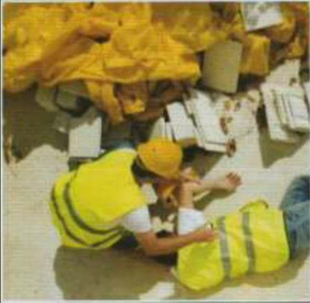
İşçilerin Yaralanmasını Engeller