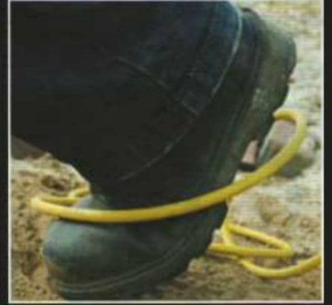
İşçilerin Takılmaya Bağlı Düşmelerini Engeller